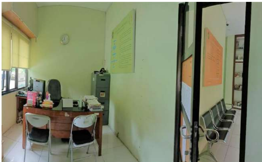
Gambar 3. Fasilitas Pelayanan Informasi Publik.

Ruang Pelayanan Informasi ini berada di Mal Pelayanan Publik Kompleks Balaikota Yogyakarta serta Kantor Dinas Komunikasi Informatika dan Persandian Kota Yogyakarta. Ruangan ini dilengkapi dengan satu unit komputer, satu pesawat telepon, dan tempat duduk untuk petugas dan penerima layanan. Publik juga dapat melakukan permohonan informasi secara online dan penyampaian keberatan melalui ppid.jogjakota.go.id dan e-mail ppid@jogjakota.go.id . Layanan online melalui website ini telah tersedia sejak tahun 2019.