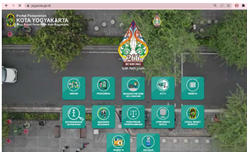
Gambar 1. Tangkapan Layar Portal jogjakota.go.id

Untuk media website, Pemerintah Kota Yogyakarta telah memuat informasi publik pada portal jogjakota.go.id . Informasi tersebut juga dapat diakses pada subdomain ppid.jogjakota.go.id . Pada tahun 2019, seluruh Perangkat Daerah/Unit Kerja hingga di tingkat Kelurahan telah memiliki dan mengelola Sub Domain/Website. Konten informasi publik di setiap subdomain ini diupayakan memuat informasi publik yang sesuai dengan ketentuan dalam Pasal 9, 10, dan 11 UU KIP mengenai informasi yang wajib disediakan dan diumumkan secara berkala, informasi yang wajib diumumkan serta-merta, dan informasi yang wajib tersedia setiap saat.